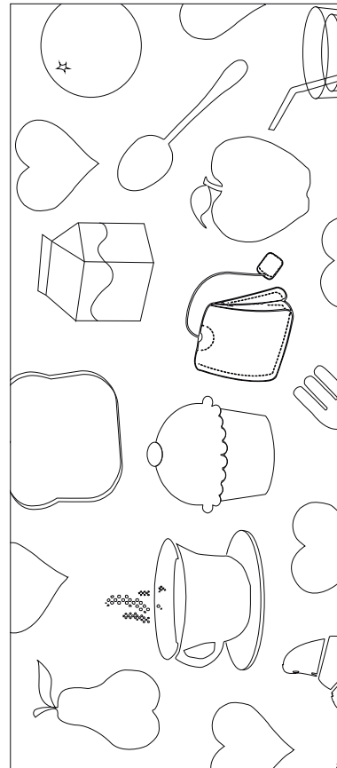
SERVILLETERO Enrollar para introducir servilleta