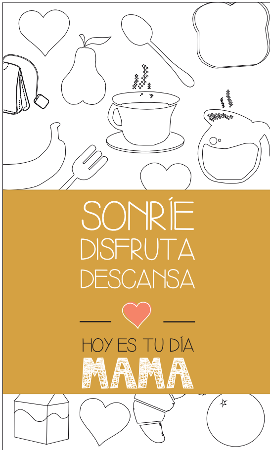
COLGADOR PUERTA Se le pondrá un cordel